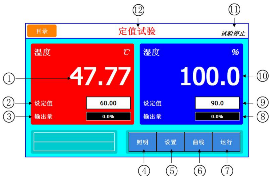
图 [2-2] 定值实验主画面