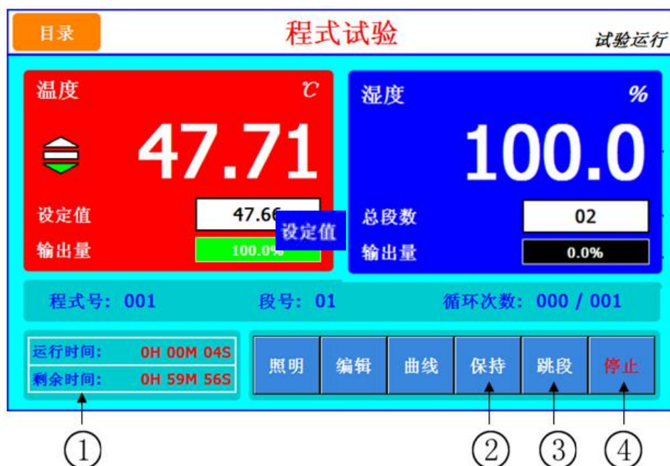
图 [3-3] 程式实验