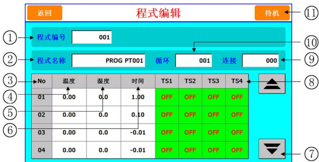
图 [3-2] 程式编辑