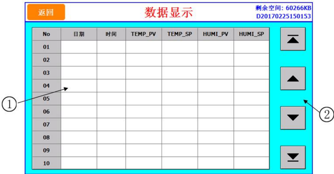
图 [6-3] 数据显示