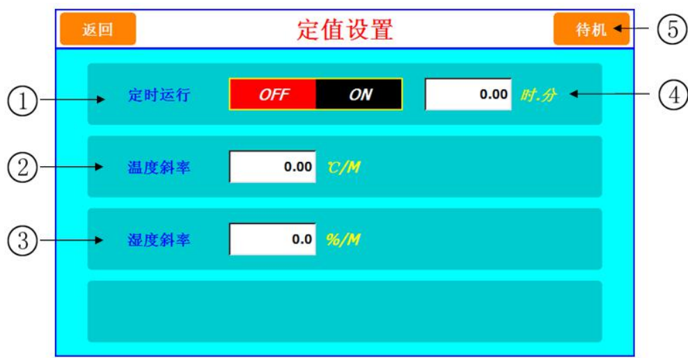
图 [2-3] 定值设置