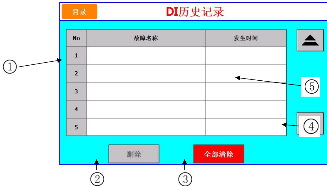
图 [7-1] DI 故障记录