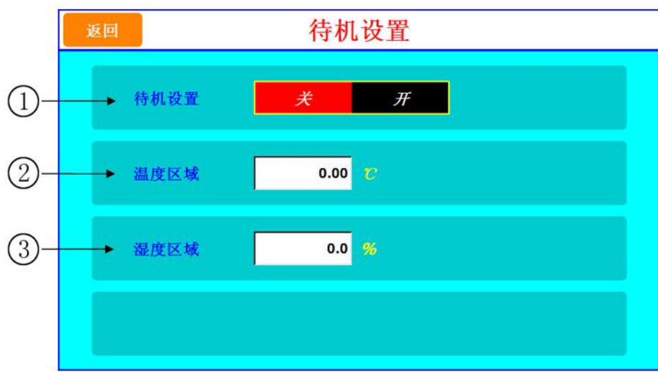
图 [2-4] 待机设置