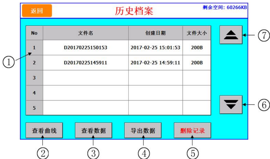
图 [6-1] 历史档案主画面