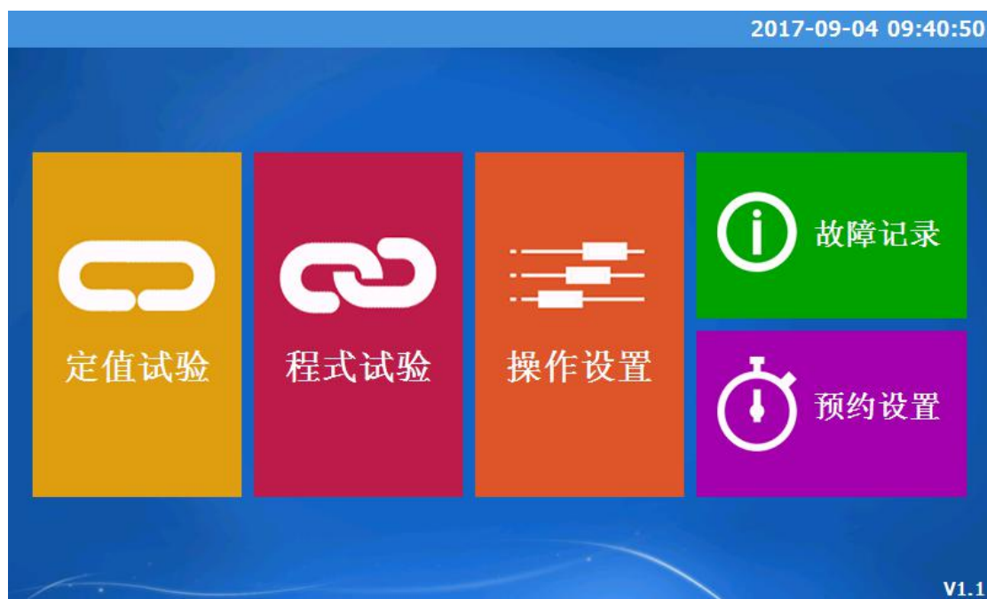
图 [2-1] 系统主画面