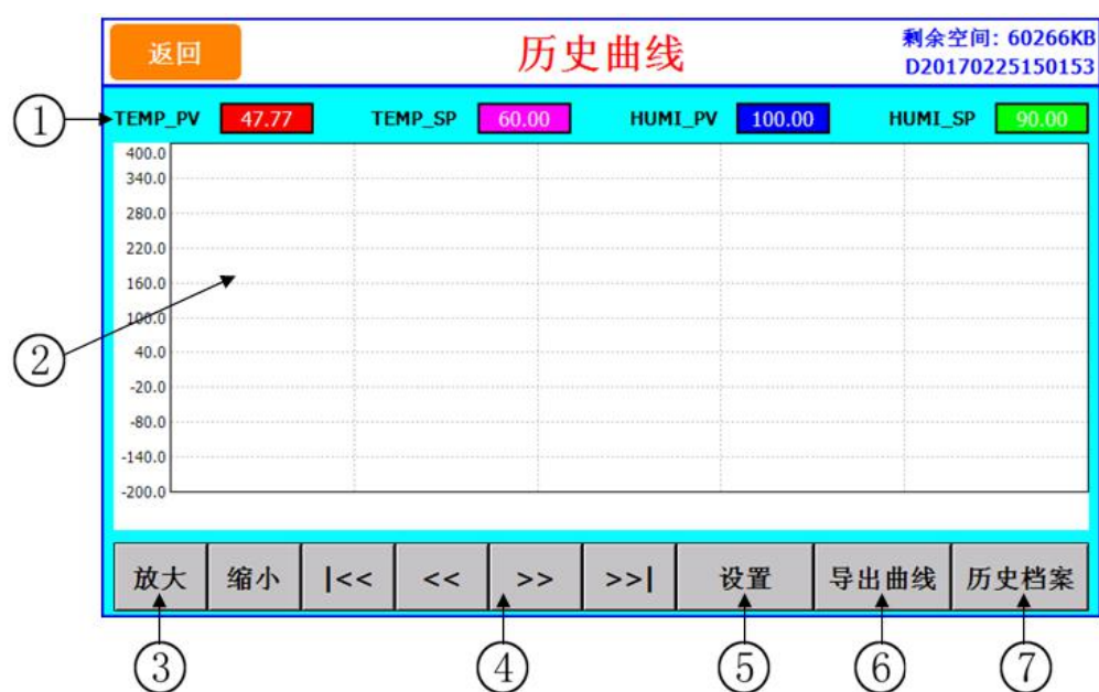
图 [6-2] 历史曲线