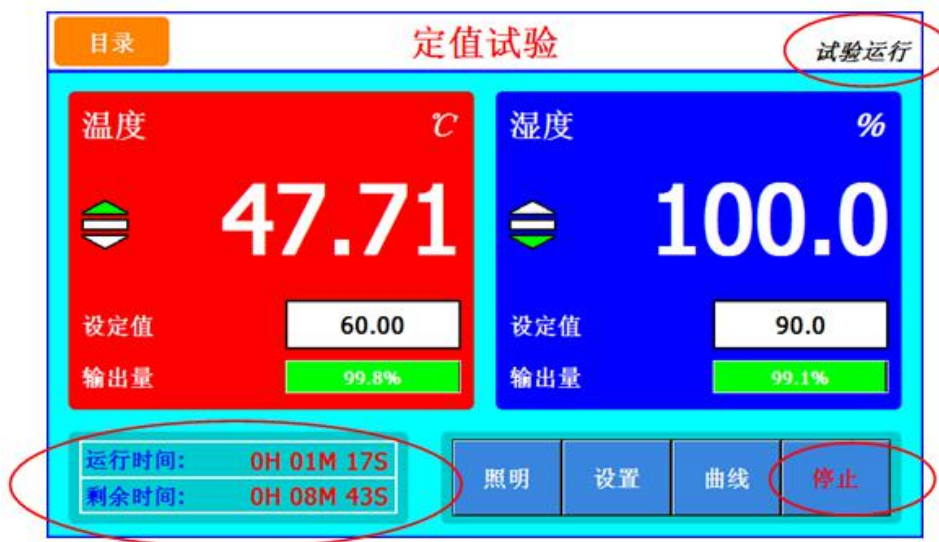
图 [2-4] 定值运行画面